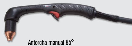
Antorcha manual 85°

Estilos de antorchas robóticas Duramax® Hyamp™ (para ver más opciones de antorchas, visite www.hypertherm.com )