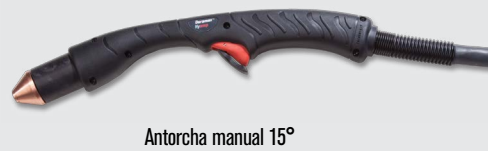
Antorcha manual 15°