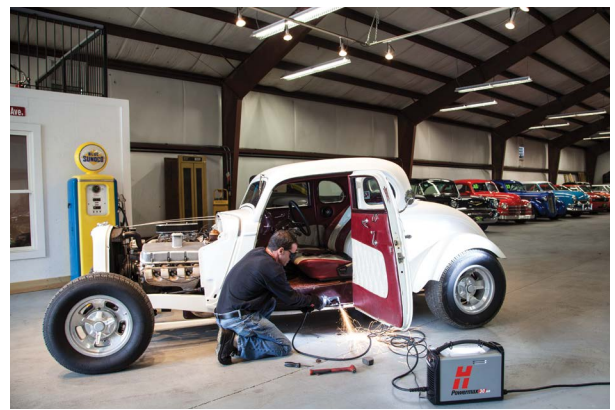
Reparación y modificación de vehículos