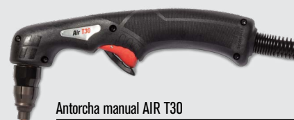
Antorcha manual AIR T30